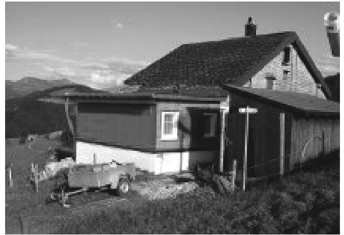
Der neue Anbau schliesst nahtlos an die rustikale Skihütte an

Schlussendlich konnte der Ski-Club Pfungen alle Hürden überwinden. Deshalb steht nun in Ebnat-Kappel inmitten einer Kuhweide ein Anbau mit Warmwasser, neuen WCs und zwei Duschen. Mit seinem feuerroten Anstrich leuchtet er in der Toggenburger Abendsonne wie ein roter Monolith.