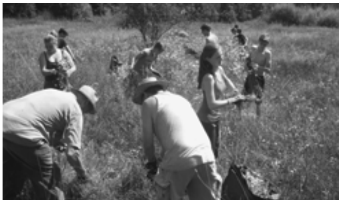
Fleissige Hände – schnelles Ende!

Um die Mittagszeit, nach getaner Arbeit, haben unsere Chuchichefs feines Grilliertes aufgetischt, danach sasssen wir noch ein wenig beieinander und liessen den schweisstreibenden Vormittag ausklingen.