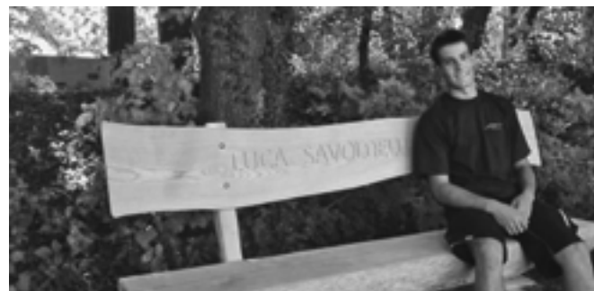
Eine gediegene Bank an einem schönen Platz an unserem schönen Brinerweiher