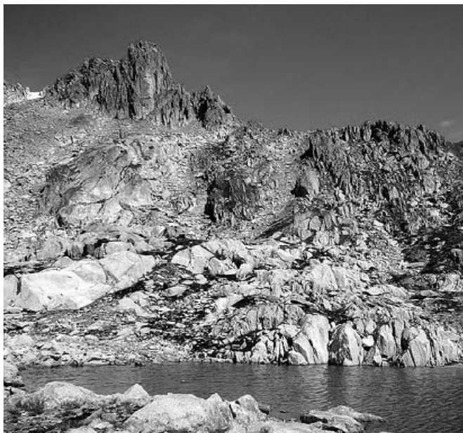
Lai Selvadi mit Blick zum Chrüzlistock