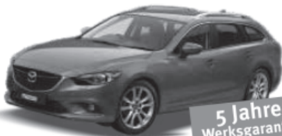
Neu Mazda 6 4x4 Mit der einzigartigen SKYACTIV Technologie