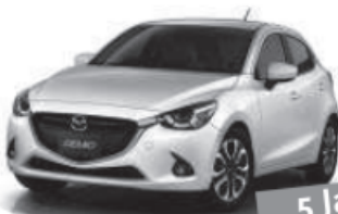
Neu Mazda 2 Der sportliche Kleine