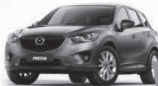
Neu Mazda CX-5 Facelift Leidenschaftlich anders