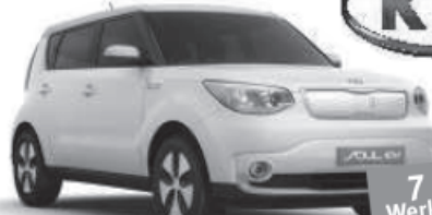
KIA Soul EV Vollelektro Effizient, konsequent und durchgedacht